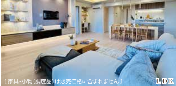
[家具・小物(調度品)は販売価格に含まれません]