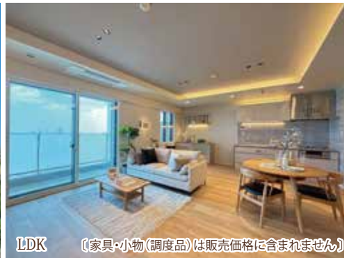
LDK (家具・小物(調度品)は販売価格に含まれません)