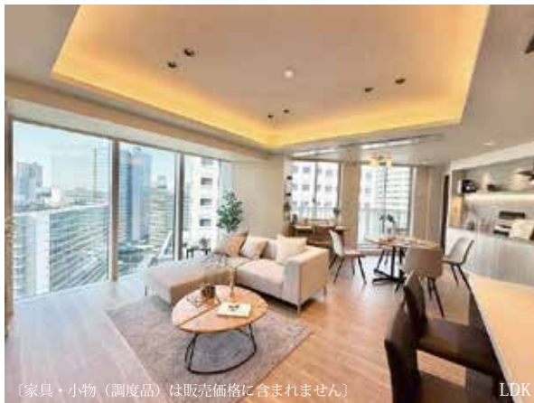
〔家具・小物（調度品）は販売価格に含まれません〕