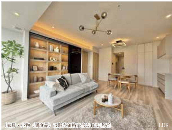
【家具・小物(調度品)は販売価格に含まれません】

※本図面の記載内容は図面制作時点のものであり、その後法改正・物件概要内容・プラン(仕様)など変更が生じる可能性がございますので、ご購入契約前に必ず最新情報をご確認ください。※登記時の司法書士は売主指定となります。※眺望については将来に渡って保証されるものではありません。