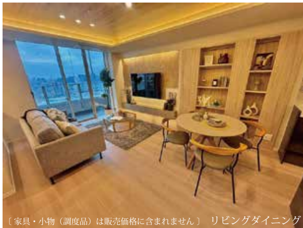
〔家具・小物（調度品）は販売価格に含まれません〕 リビングダイニング