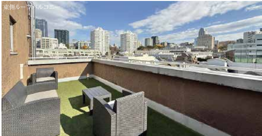
東側ルーフトバルコニー