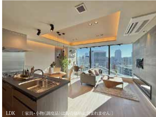
LDK [家具・小物(調度品)は販売価格に含まれません]