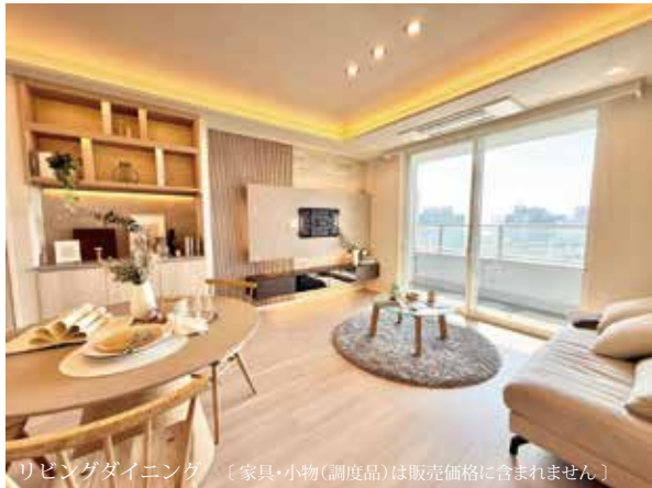
リビングダイニング [家具・小物(調度品)は販売価格に含まれません]