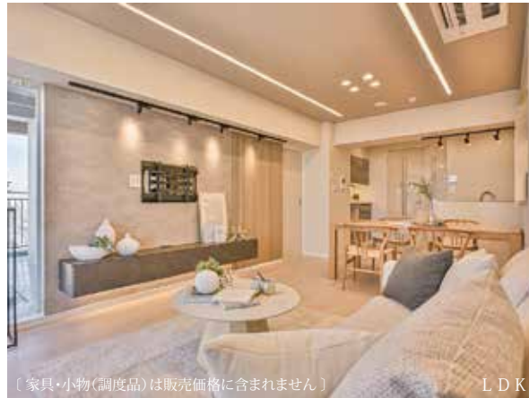
【家具・小物(調度品)は販売価格に含まれません】