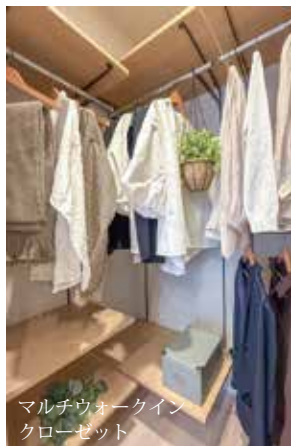
マルチウォークイン クローゼット