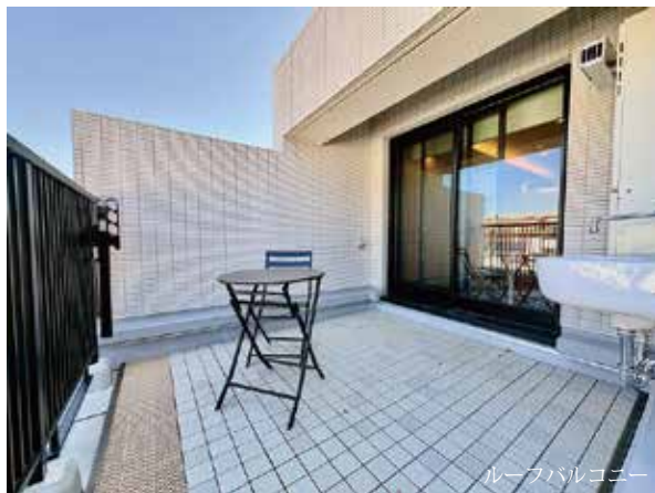
ルーフバルコニー