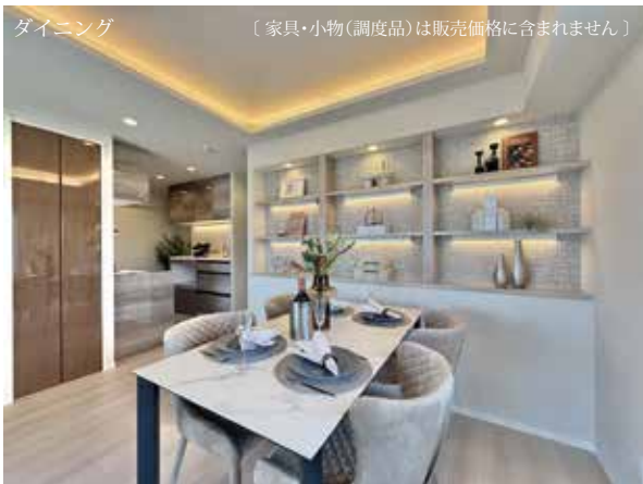
ダイニング [家具・小物(調度品)は販売価格に含まれません]