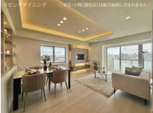
リビングダイニング [家具・小物(調度品)は販売価格に含まれません]