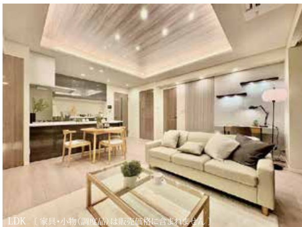
LDK (家具・小物(調度品)は販売価格に含まれません)