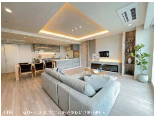
LDK (家具・小物(調度品)は販売価格に含まれません)