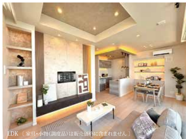
LDK [家具・小物(調度品)は販売価格に含まれません]