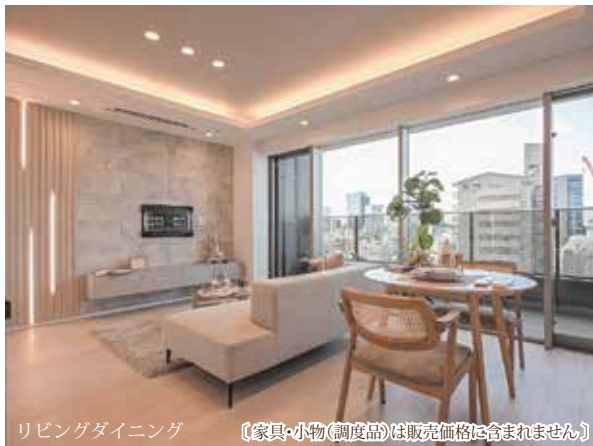
リビングダイニング 【家具・小物(調度品)は販売価格に含まれません】