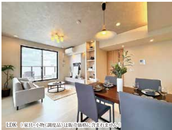
LDK (家具・小物(調度品)は販売価格に含まれません)