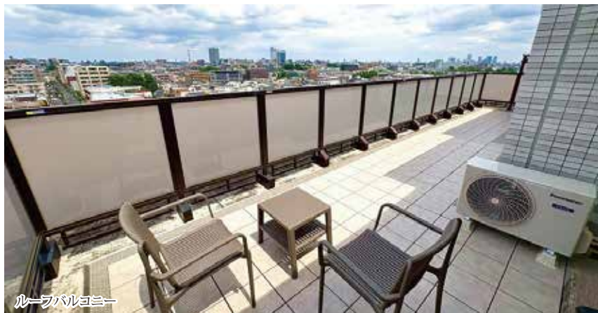
ルーフバルコニー