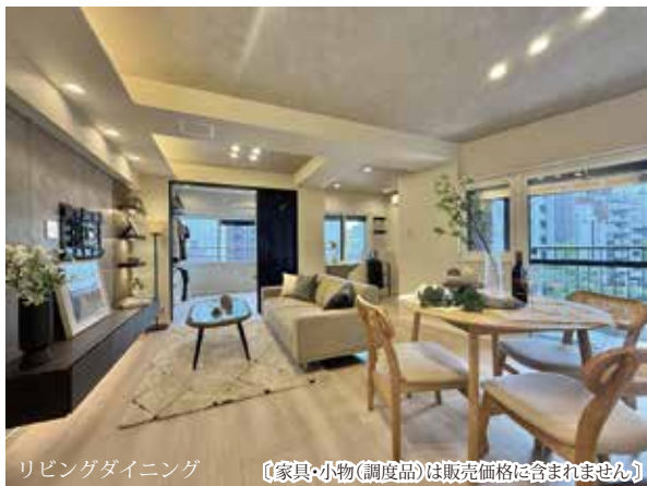
リビングダイニング 〔家具・小物(調度品)は販売価格に含まれません〕