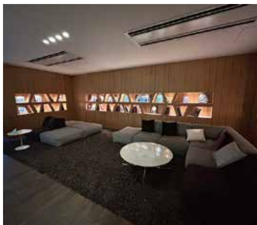
※家具・小物（調度品）は販売価格に含まれません