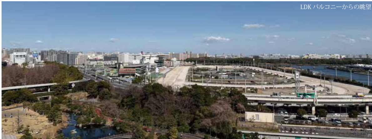
LDKバルコニーからの眺望