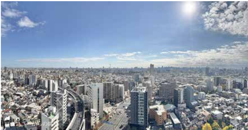
バルコニーからの眺め