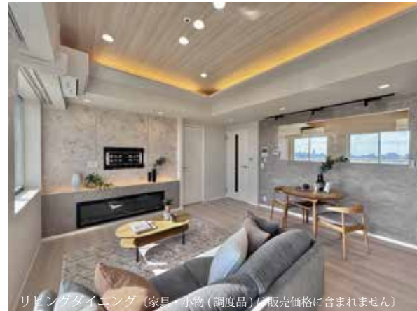
リビングダイニング(家具・小物(調度品)は販売価格に含まれません)